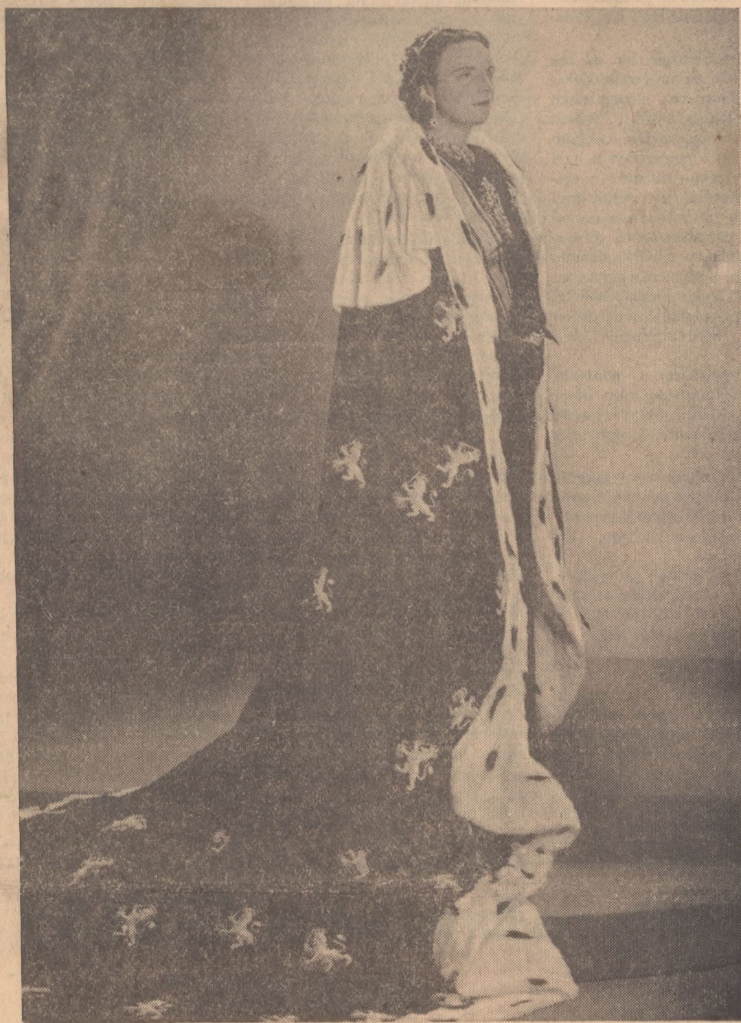
Su Mahestad Reina Juliana

Redaccion: Conscientiesteeq 27 • Telefono No. 4318 • Pa coreo: Box No. 655 — Administracion: Conscientiesteeq 29 • Memstad - Curaçao A. N. • Telefono No. 4399 — Oficina na Aruba: Lloyd G. Smith Boulevard 39 • Oranjestad • Telefono No. 1233